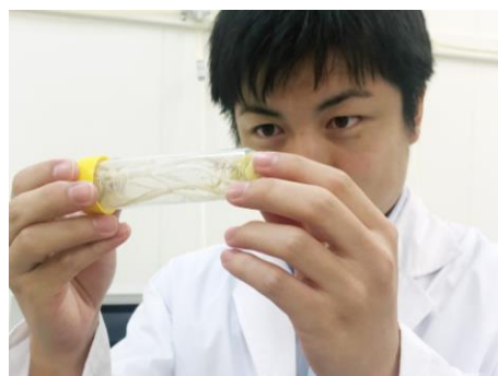
新規天然化合物の探索