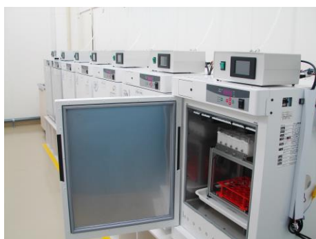
プロモーターボックス