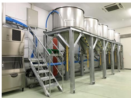
食品用発芽タンク